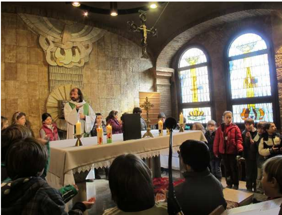
KATECHESE DER ERSTKOMMUNIONKINDER