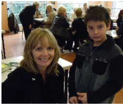
TRÖDELMARKT am 4. Adventssonntag.