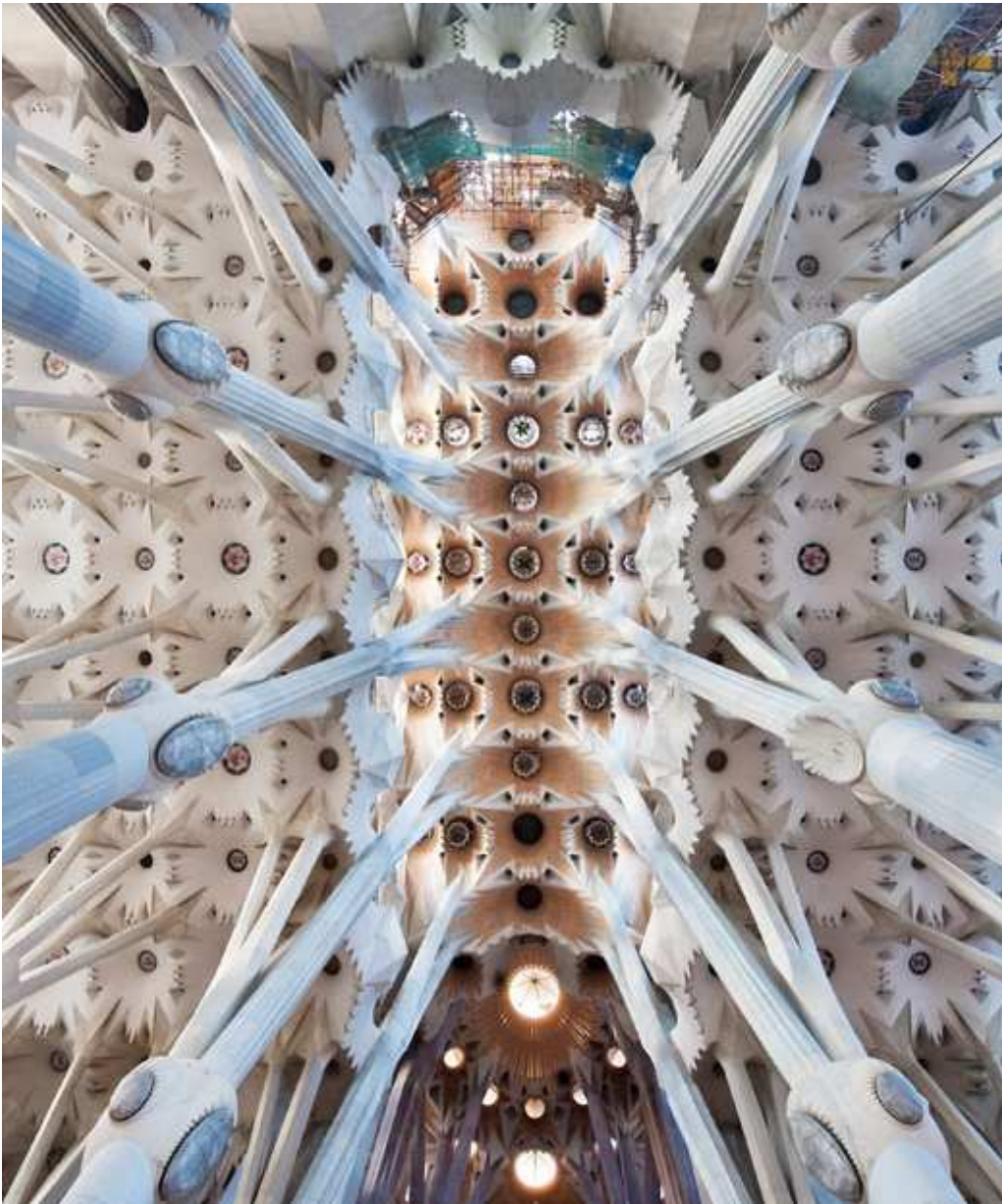
„Sternenhimmel“, Ansicht der Gewölbe der Sagrada Família