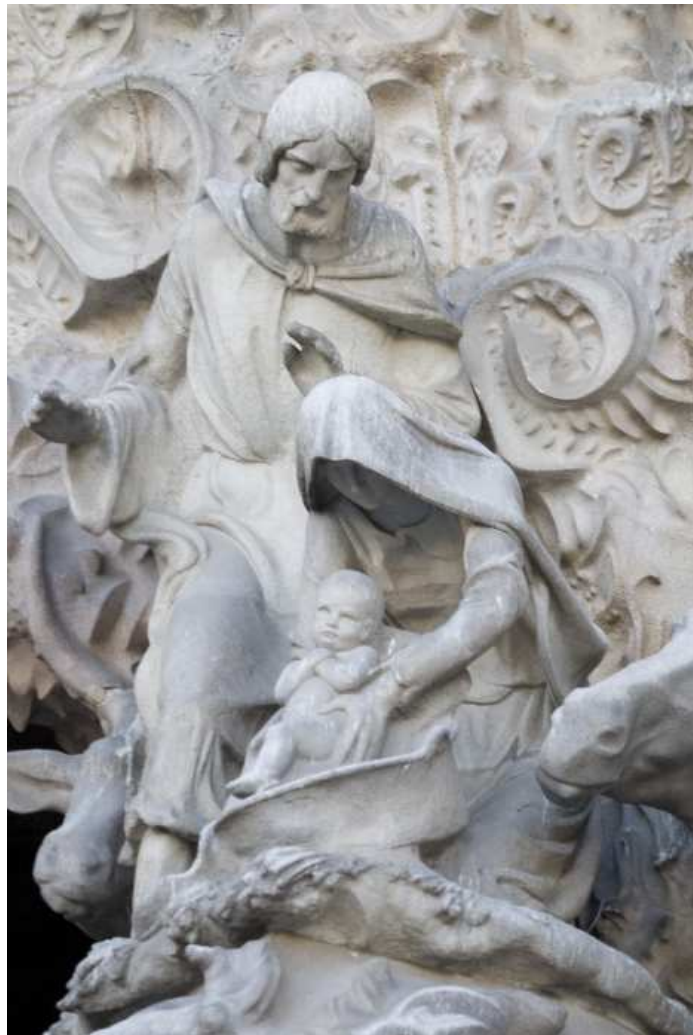
Sagrada Família von Joan Busquets 1958