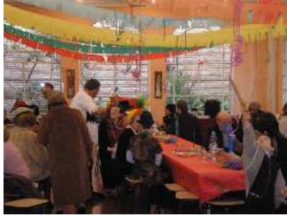
...der geschmuckte Gemeindesaal...